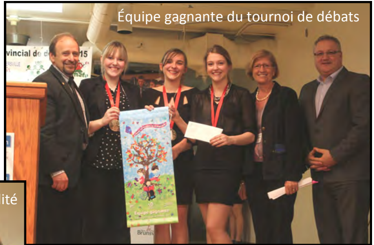
Équipe gagnante du tournoi de débats

20- 21 mars 2015 École secondaire Assomption Rogersville