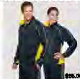
Ensemble de marche