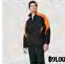
Ensemble de marche

Vous économisez du temps, de l'argent et évitez ainsi de mauvaises surprises.