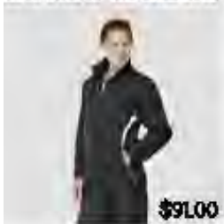
Ensemble de marche