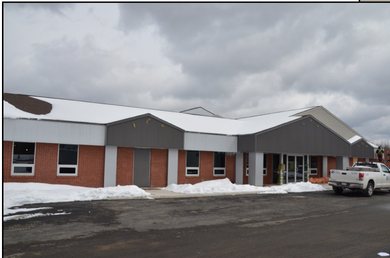
L'extérieur de l'édifice municipal