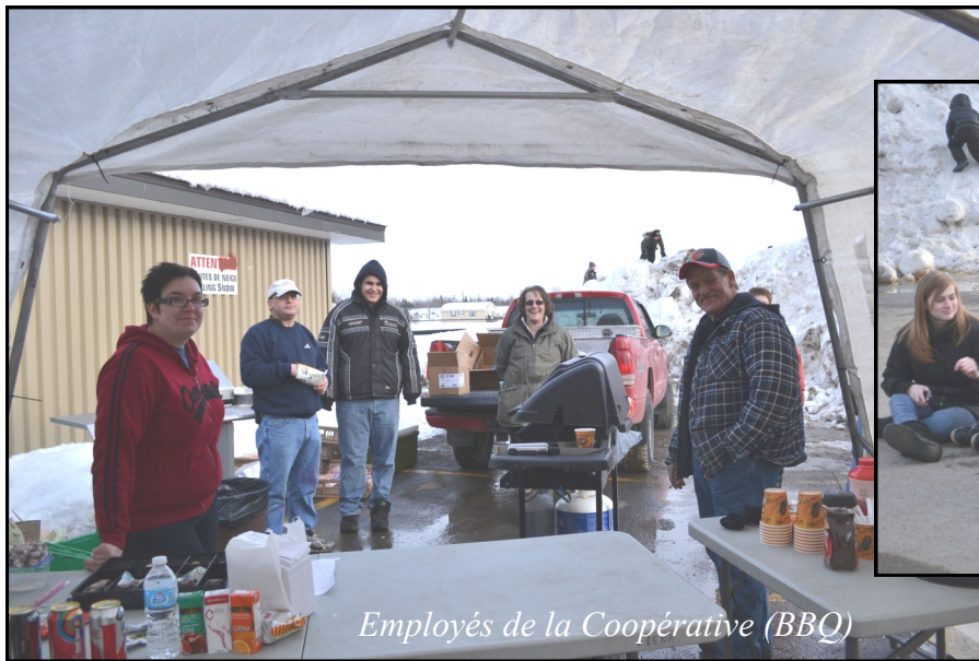
Employés de la Coopérative (BBQ)