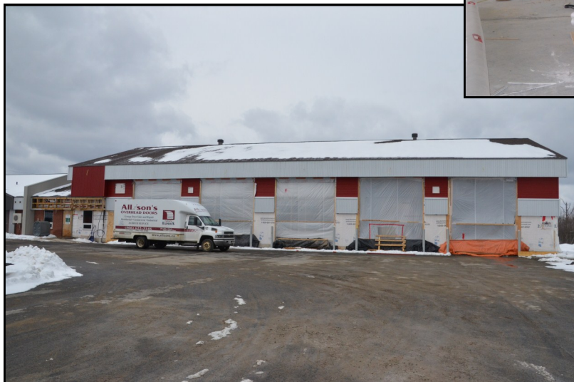
L'extérieur de la caserne