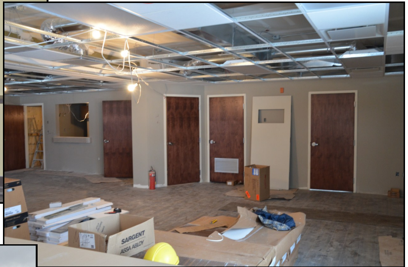
Salle de conférence