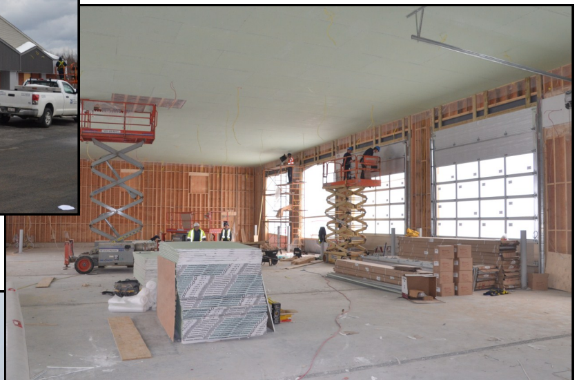
L'intérieur de la caserne