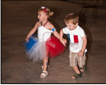
Des jeunes de la communauté