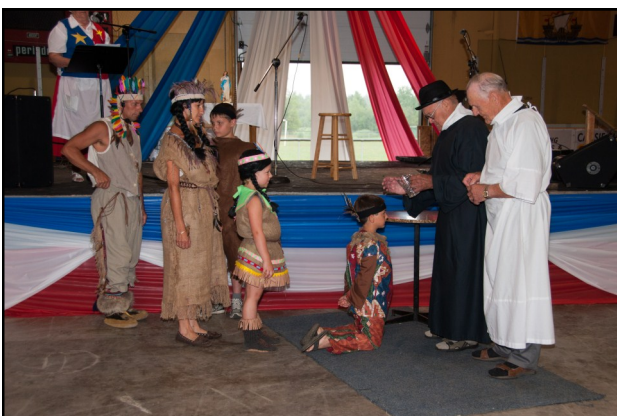
La pièce de théâtre présentée le 12 août