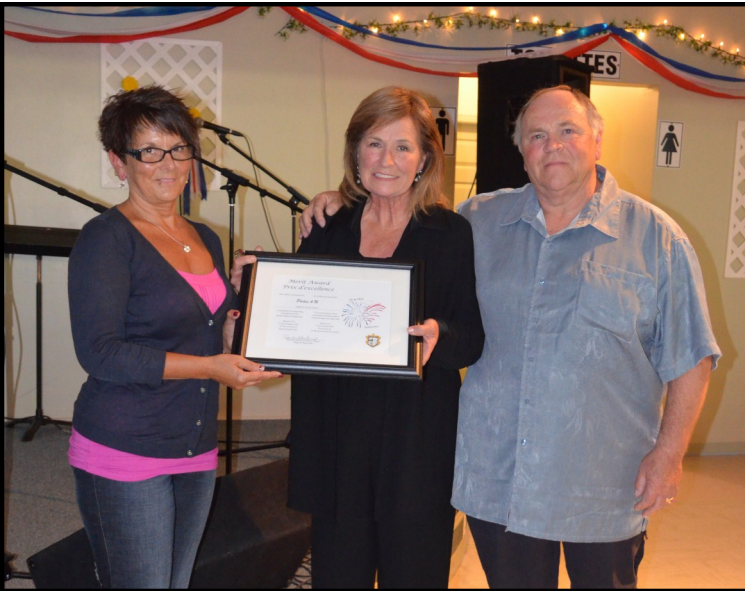
Catégorie: Arts et cultures