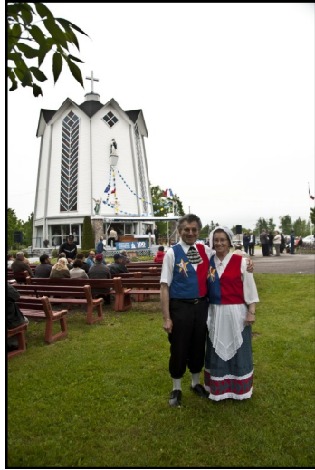
Des gens de la communauté