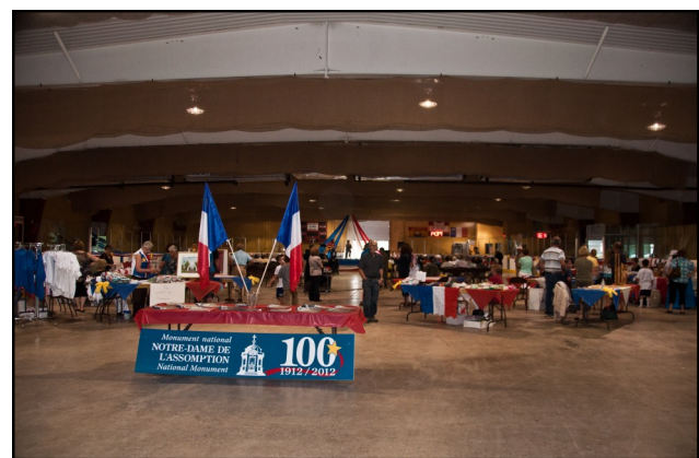
Les artisans présents le 12 août