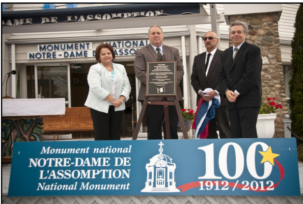
Plaque dévoilée pour commémorer le 100e du monument