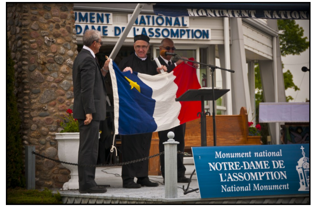
Le sénateur Fernand Robichaud, le 10 juin