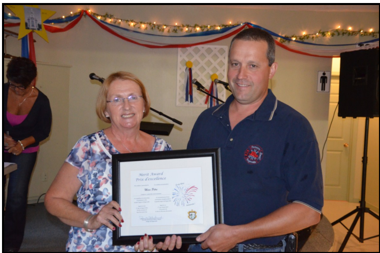
Catégorie: Leadership communautaire

Le 1 er août dernier, avant le début du frolic, la municipalité a décerné les certificats pour les prix d'excellence du N.B. aux gens qui l'ont mérité cette année. Ces prix sont divisés en 6 différentes catégories soient: Leadership communautaire, Service bénévole, Arts et culture, Affaires, Environnement et Sports, loisirs et vie active. Voici l'histoire de chacun d'entre eux.