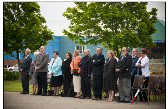
Les dignitaires à la célébration du 10 juin