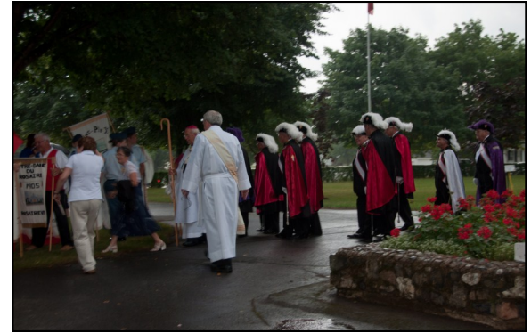
Les Red Eagles à la célébration du 14 août