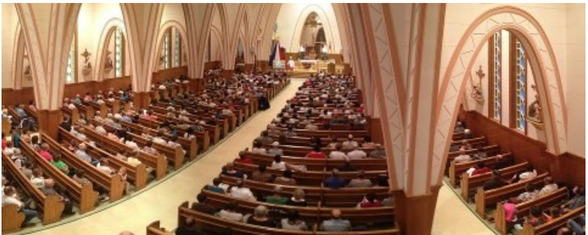
La célébration du 15 août

Le gallant RESTAURANT & TAKE OUT CLUB 126 RESTO BAR TERRY GALLANT