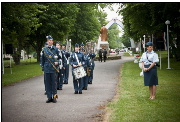
Les cadets de l'air ont joué le O Canada, le 10 juin