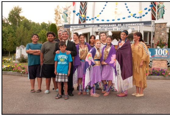
Le peuple Mi'kmaq durant la déportation, un groupe de la Première Nation Esgenoopetitj