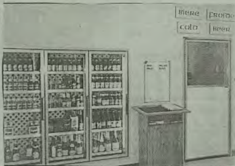
On peut voir sur la photo la chambre froide de l'agence d'alcool pour ceux et celles qui préfèrent cette boisson à température réfrigérée.

La première coopérative de consommation à Rogersville prit naissance en 1920. Plusieurs personnes avaient investi substantiellement dans cette entreprise mais les circonstances entraînèrent la faillite du magasin à l'arrivée de la dépression.