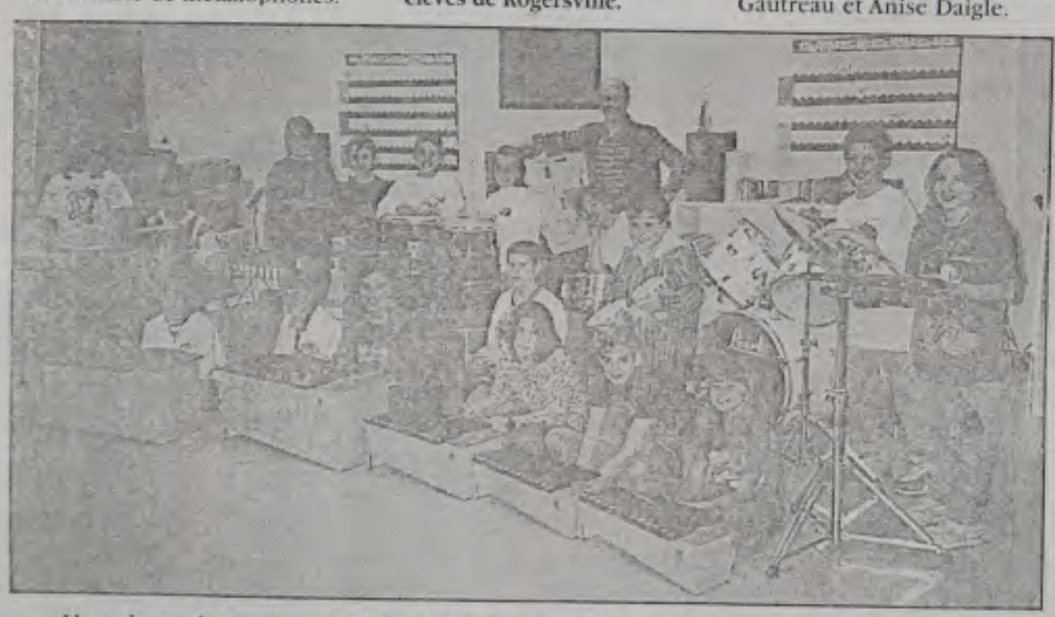
Une classe de musique de l'école W.-F. Boisvert de Rogersville.

Ceci est le dessin de Nicole pochette de la cassette des élèves de Rogersville.