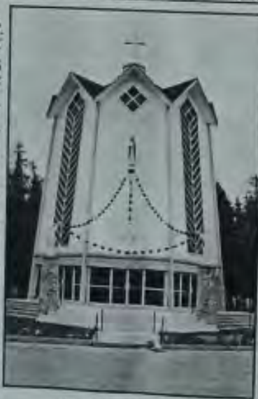
Acadian National Monument Acadien National

The village of Rogersville, 30 minutes south of Miramichi, offers visitors and residents alike a variety of outdoor activities headed by fishing and canoeing in the summer months, snowshoeing, snowmobiling, and cross country skiing during the winter months. A Brussels Sprouts Festival, in late July - early August, celebrates the success the area has experienced in producing the popular crop. The village is also well-known as the home of two religious orders, the Trappistines and Trappistes, who live mainly from farm produce, communion hosts and wine which they produce.