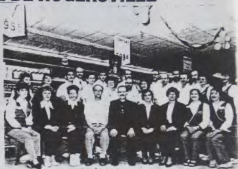
Les employés de la Coopérative.