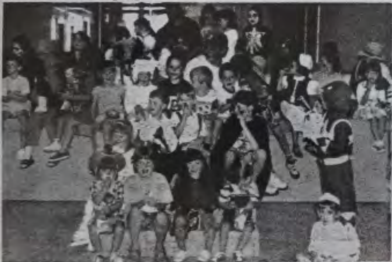
Les jeunes de Rogersville ont participé en grand nombre à la journée costumée.