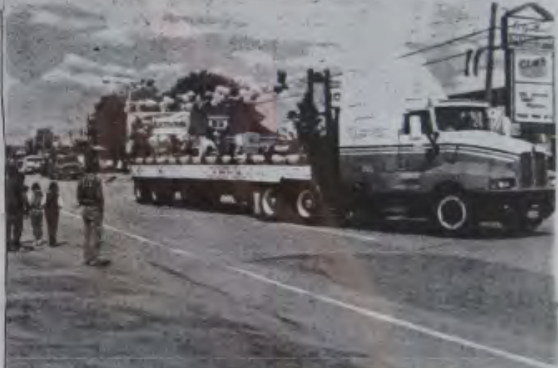
Le 19e Festival des Choux de Bruxelles de Rogersville est maintenant chose du passé. En effet, plusieurs activités ont eu lieu entre le 29 juillet et le 6 août. Ci-haut, deux photos souvenirs prises lors de la parade qui s'est déroulée le dimanche 6 août.